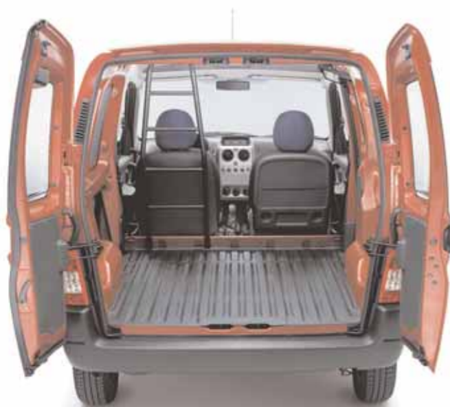
Tapis caoutchouc dans l'espace de chargement disponible en post-équipement