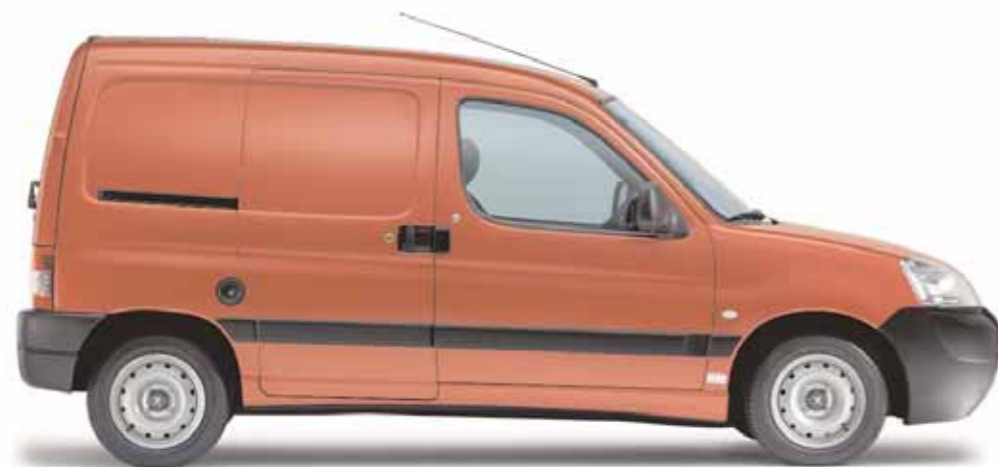
Fourgon avec option porte latérale coulissante

Avec Partner Origin, vous conduisez un utilitaire qui s'adapte à toutes les facettes de votre activité, et qui exprime, auprès de vos clients, votre dynamisme et votre savoir-faire.